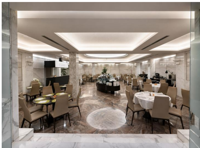
Ristorante “Quattro Stagioni”

Se comunicate con anticipo, la cucina cercherà di provvedere ad ogni esigenza speciale .